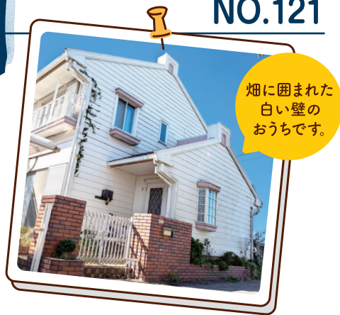
畑に囲まれた 白い壁の おうちです。