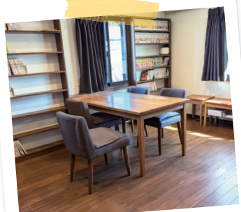
まんが図書館は2階の一室。 南東向きで日当たりのいいお部屋です。