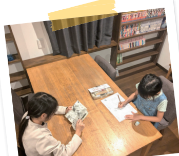
まんがを読んだり、宿題をしたり 自由に過ごせる場にしたい。